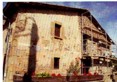
Eliminació dels morters de calç.