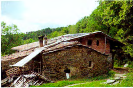
Destrucció de la fesomia dels volums.